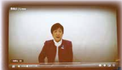
東京都知事小池百合子様より ビデオメッセージ