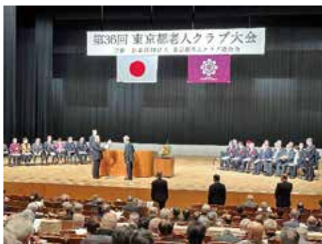
外山会長が代表受賞

今年度「東京都老人クラブ大会」は、12月5日(月)新宿文化センターにて盛大に開催され、本区関係では次の皆さんが受賞されました(以下すべて称略)。