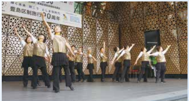
第2ブロック合同チーム