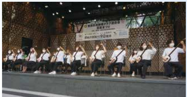
早稲田大学津軽三味線愛好会「三津巴」