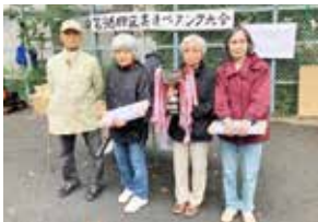
入賞チームの皆さん