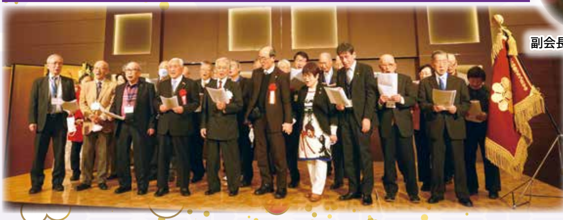
全員で「ふるさと」を合唱