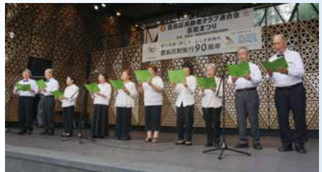
南長崎四丁目福寿会