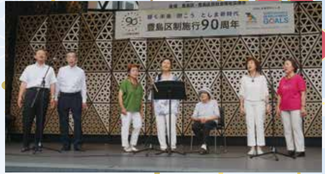
千川二丁目百々代会