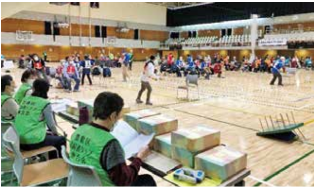
熱戦が繰り広げられた会場のようす