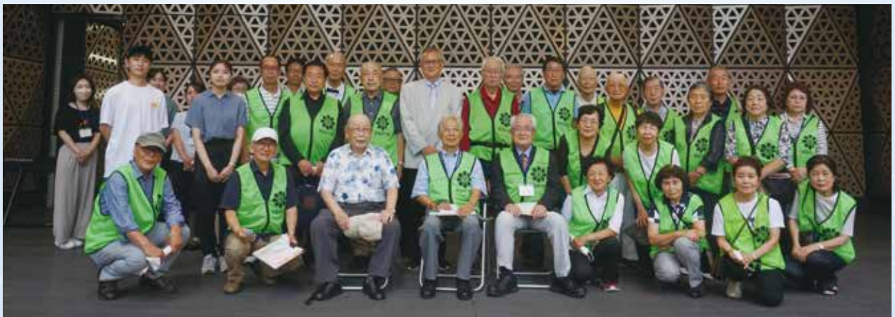
「創立 60 周年記念芸能まつり」を盛況裏に終えて実行委員会記念撮影。 区職員と大正大学生の皆様も大変ご苦労様でした。