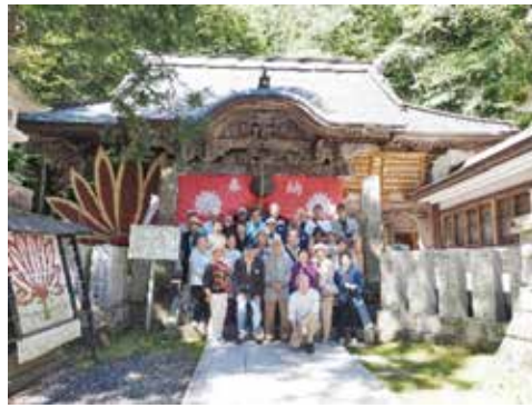
迦葉山 龍華院 弥勒護国禅寺にて