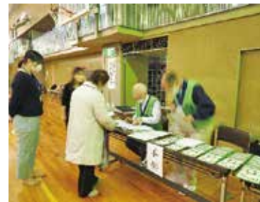
体力測定会の受付

▼区高連で採用しているのは「60歳以上の高齢者用測定」で、とくに測定前に「ADLチェックリスト」にご記入いただくことで、測定参加