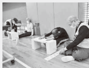
体力を知って自分に合った運動を