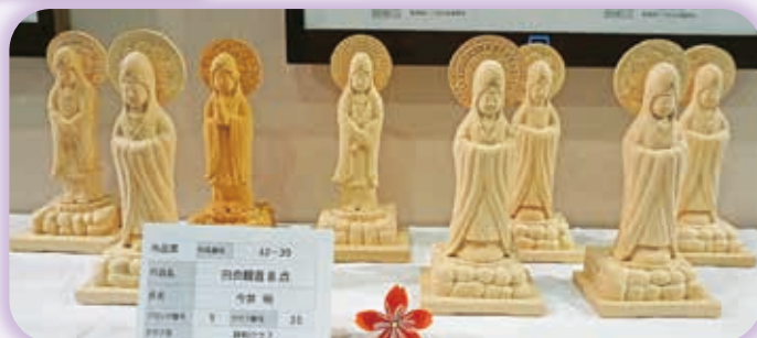
繊細で美しい作品も数多く展示