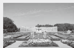
美しい花々が咲く公園

庭園の薔薇、温室のペゴニアの花が美しく咲き乱れていました。深大寺山門付近には美味しい蕎麦屋さんがたくさんあります。おろし蕎麦が800円でした。