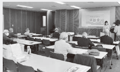
熱心に受講するみなさん