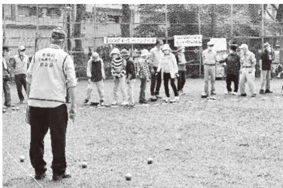
真剣な眼差しで投球