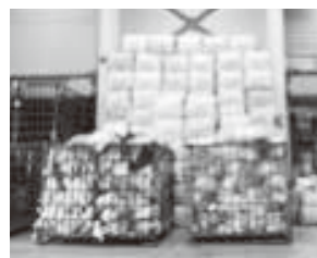
圧縮梱包しコンテナ で送るのです

ました。さらに嬉しい知らせがありました。南スーダンで古着を受け入れて配布するのは、かつて私たちが支援していた難民キャンプの若いスタッフがアメリカとカナダへ移住して運営し始めたNGOということでした。つまりわかちあい活動の中から、新しいリーダーが生まれたのです。これは望外の喜びでした。