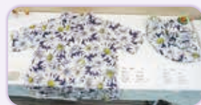
洗練された数々の作品

大型の額入り作品もあり、作 品の種類は、絵手紙・絵画・折 り紙・切り絵・色鉛筆画・水彩 画・版画・油彩画・ちぎり絵・ 写真など。また机上の展示は、 手芸品・編み物・パンフラー! 仏像彫刻・バッグ・手作り袋物 ・帽子・ブラウス・セーター・ マフラーなど、出品点数90点、 出品者数は61名でした。 作品は力作揃いで素晴らしい 物ばかりでしたが、コロナの影 響か出品数が少なく、手狭な会 場に不思議とちようどよく展示 できました。