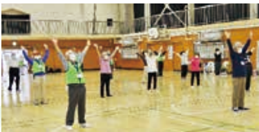
運動をして健康な身体づくり