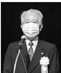
外山会長が閉会の辞を述べました