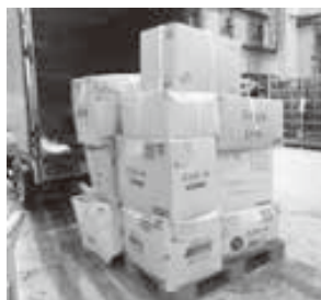
集めた古着を詰めた 段ボール