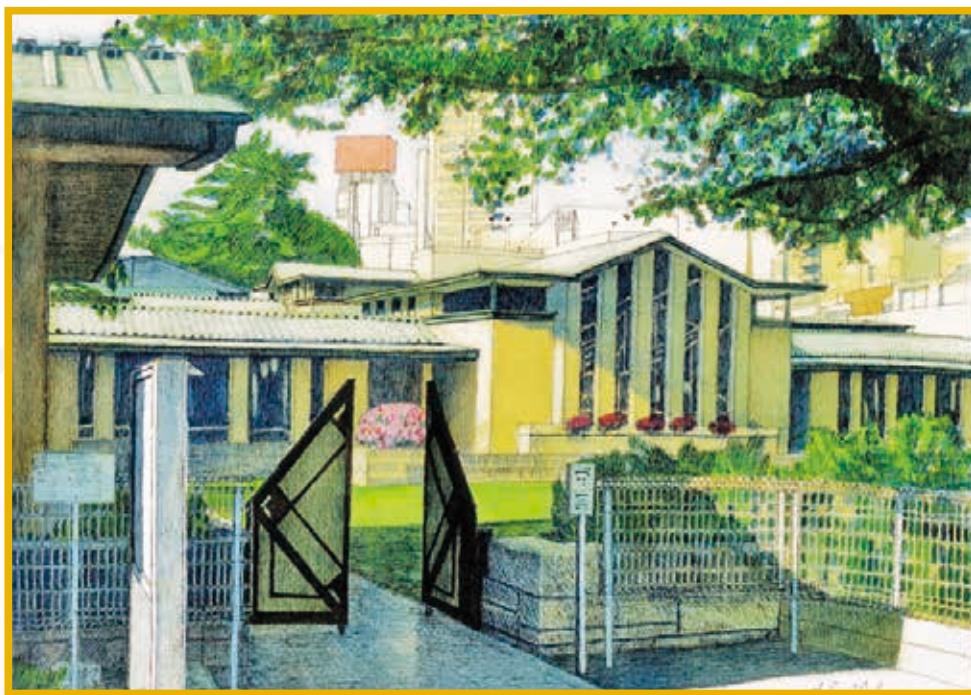
ちばら町並み美術館（千原昭彦氏画）