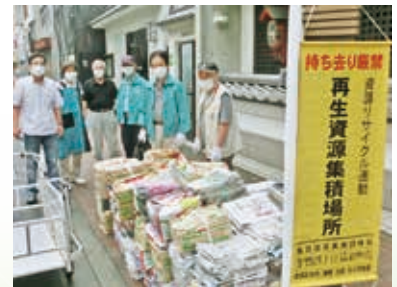
ゴミではなく資源として集めます