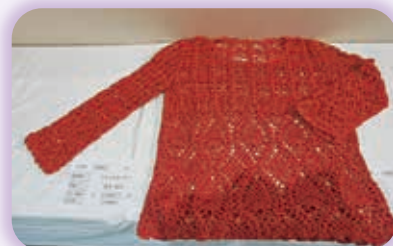
ぬくもりあふれる作品たち