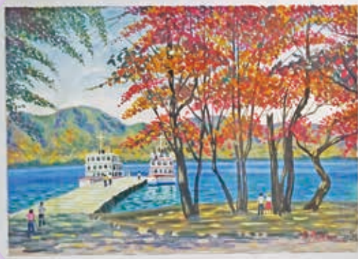
目を奪われる素晴らしい作品ばかり